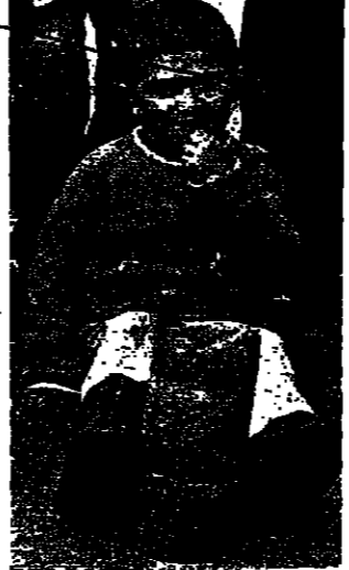
ظل في ميلا الشعب وامامه تلمة من احدى قتال مدفعية العدو

صيدا - من نزيه نقوزي : قصفت مدفعية العدو عدة مناطق في الجنوب امس . تعرض وادي الزرقا الممتد بين يارين والقصيرة والتلال المحيطة ببادية البستان ، للقصف الاسرائيلي . وقد تساقطت قتال مدفعية العدو على بلدة ميلا الشعب ، وتوق القتال المرشحة على البلدة ، اتخذت مجزرتان اسرائيليان موقفا في مكن جديد اقيم للمرافعة . وفي القصيرة يقضاه صومر ، سمعت طلقت الاسلحة الرشاشة امس . ( التفاصيل على الصفحة ٤ )